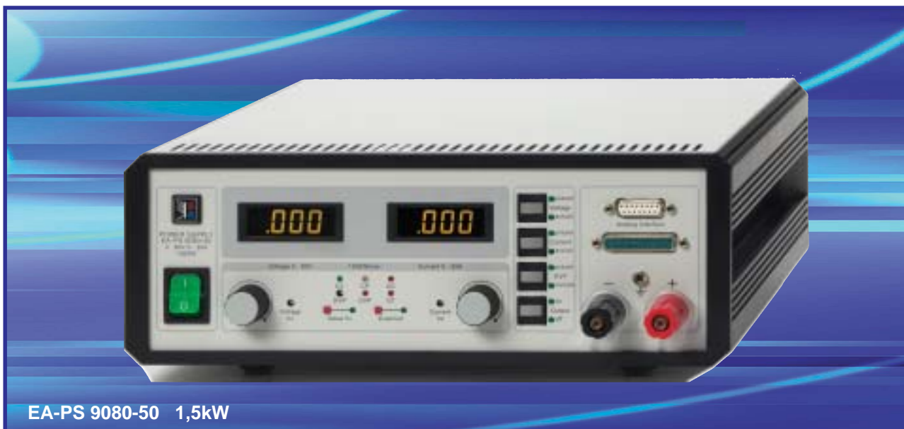
EA-PS 9080-50 1,5kW