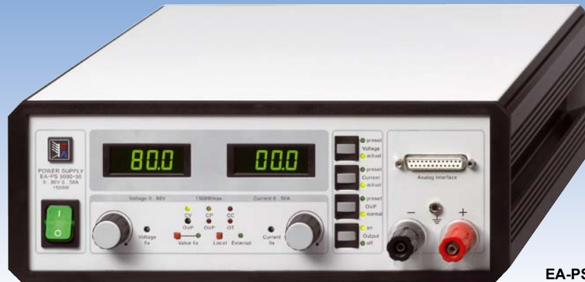
EA-PS 9080-50 T