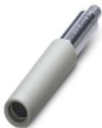
Prüfsteckerbuchse, Farbe: grau

Bitte beachten Sie, dass die hier angegebenen Daten dem Online-Katalog entnommen sind. Die vollständigen Informationen und Daten entnehmen Sie bitte der Anwenderdokumentation. Es gelten die Allgemeinen Nutzungsbedingungen für Internet-Downloads. ( http://phoenixcontact.de/download )